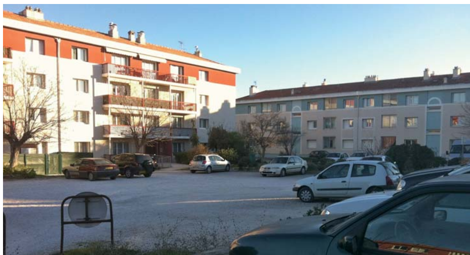
Emplacement des constructions prévues au Clos Meunier

Est-il judicieux d'ajouter encore 24 logements à la Cité du Clos Meunier ?