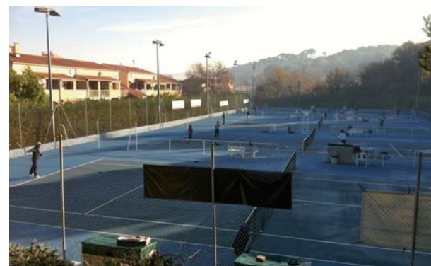
Le tennis-club pradétan : de futurs logements sociaux ?