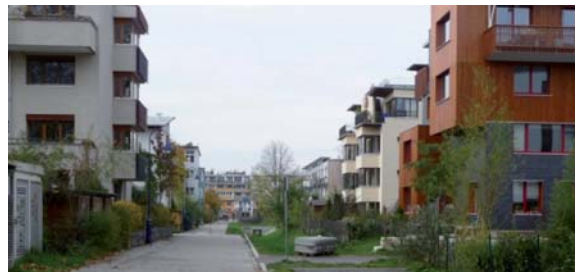
Avant et... après : aperçu de «l'ambiance» promise à La Grenouille