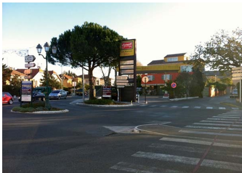
Rond-point à l'intersection des Avenues Gabriel Péri et Jean Jaurès